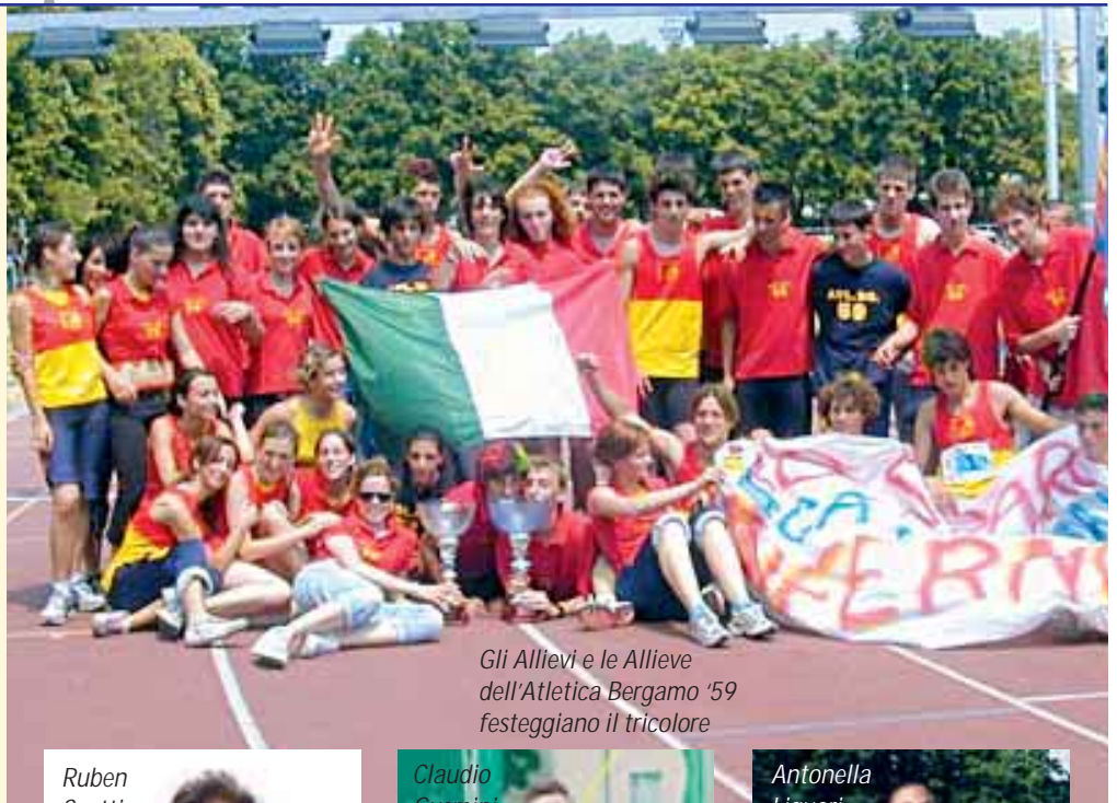
Gli Allievi e le Allieve dell'Atletica Bergamo '59 festeggiano il tricolore